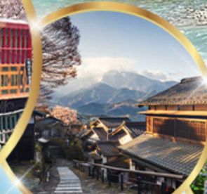
มาโกเมะจุกุ