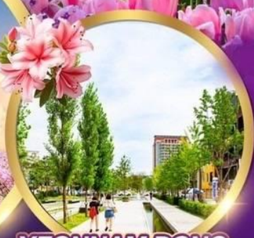
YEONNAM DONG CENTRAL PARK

ไฮไลท์ชมทุ่งดอก Azalea ฟูลมลุม เทศกาลดอกทิวลิป 1 ล้านดอก โซลทาวเวอร์ สวนป่ากรุงโซล ทะเลสาบชกชน ชมซากุระ-YEONNAM DONG CENTRAL PARK นอนพักโซล 3คืน ไม่ต้องย้ายโรงแรม