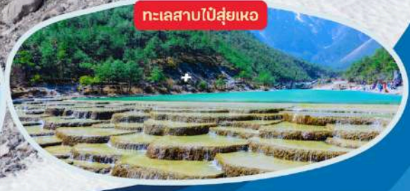
ทะเลสาบไ้ส่วยเหอ