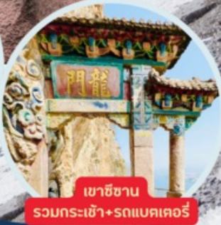
เขาสีซาน รวมกระเช้า+รถแบคเตอร์