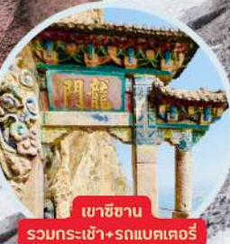
เขาชินชาน รวมกระเช้า+รถแบคเตอร์