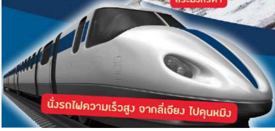
นั่งรถไฟความเร็วสูง จากลี่เจียง ไปคุณหมิง