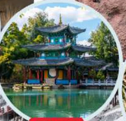
สระมังกรคำ