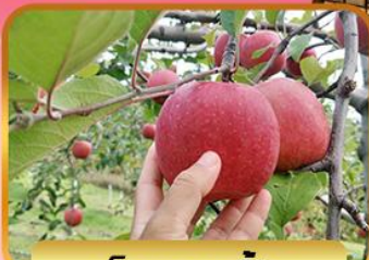
เก็บแอปเปิ้ล