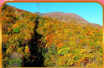
นั่งกระเช้าอุซุซัง