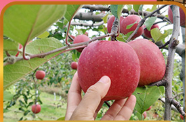
เก็บแอปเปิ้ล