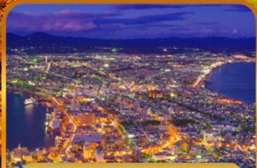
ชมวิวดาโกดาเตะ