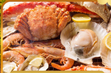
บั้งย่างร้านดังนั้นตะ