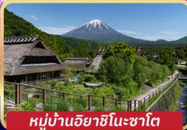
หมู่บ้านอียาชิโนะซาโต