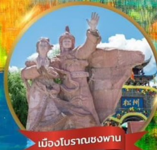
เมืองโบราณชงฟาน