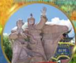
เมืองโบราณชงพาน