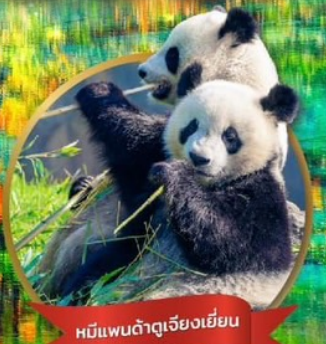
หมีแพนด้าเจียงเยี่ยน