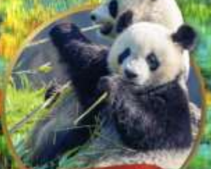
หมี่แพนด้าตู่เจียงเยิน