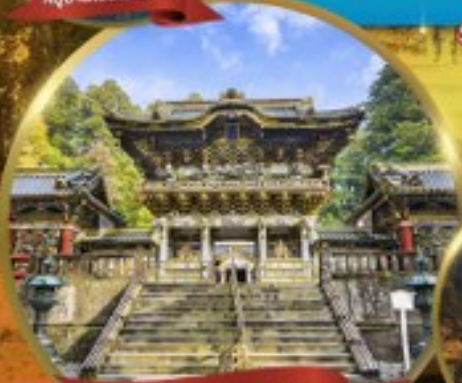
ศาลเจ้านิกโกโทโทกุ