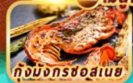
กุ้งมังกรซอสเนย