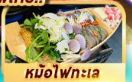
หม้อไฟทะเล