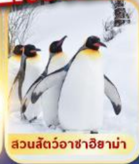
สวนสัตว์อาซาฮิยาม่า