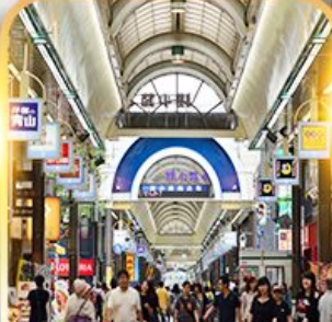
ย่านสุสุกิโนะ