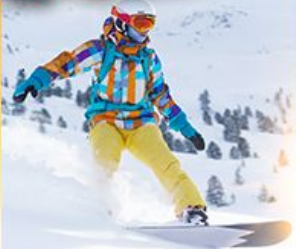
ลานสกีชิโกไซ