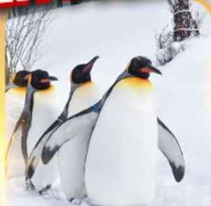
สวนสัตว์อาซาฮิยาม่า