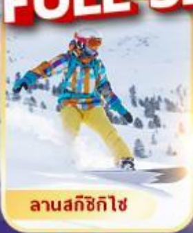
ลานสกีซิกิไซ