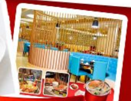
ก๊วยแม่ น้ำ + HOTPOT SEAFOOD