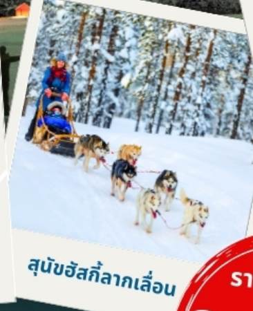
สุนัขฮัสกีลากเลื่อน