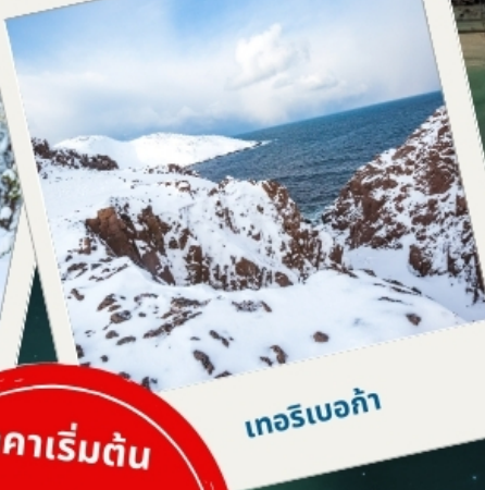
เทอริเบอก้า