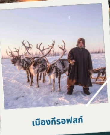
เมืองก็รอฟสค์