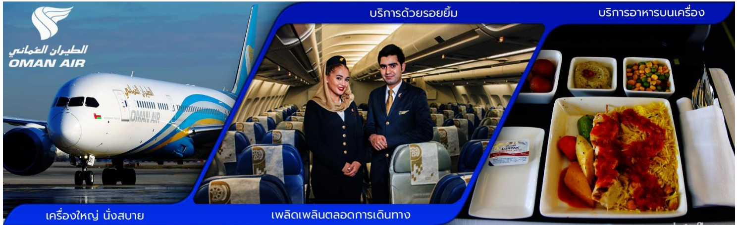
เครื่องบิน นั่งสบาย

06:00 น. คณะผู้เดินทางพร้อมกัน ณ สนามบินสุวรรณภูมิ อาคารผู้โดยสารขาออกระหว่างประเทศ ชั้น 4 ประตูทางเข้าที่ 6-7 แถว M เคาน์เตอร์สายการบินโอมาน แอร์ ซึ่งมีเจ้าหน้าที่บริษัทฯ คอยให้การต้อนรับพร้อมอำนวยความสะดวกด้านสัมภาระแก่ท่าน