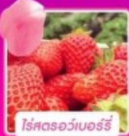
โรสตรอว์เบอร์รี่

เริ่มเดินทาง 04 มี.ค.-30 มี.ย. 2567 บินโดย Jeju Air JEJUair น้ำหนักกระเป๋า 20 Kg.