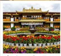
ตำหนักนอร์บูหลินมา

ชมวิวยอดเขานานเจียปาหว่า / จุดชมวิวกะเลปาหลูกลาง / อุทยานเขาเป็นยี่ / ระเบียบกระจก / วัดลามะ พระราชวังโปตาลา / วัดโจคัง / ถนนแปดเหลี่ยม / ทะเลสาบนำมูเซว / ตำหนักนอร์บูหลินมา / เมืองโบราณลั่วใต้