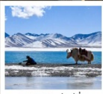
ทะเลสาบนำมูเซว