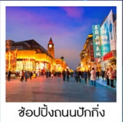
ช้อปปิ้งถนนปักกิ่ง