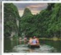
ท่องเที่ยว จางฮาน