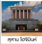
สุสาน โฮจิมินห์