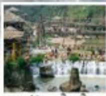
หมู่บ้าน ถัด ถัด