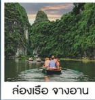
ล่องเรือ งามาน