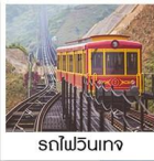
รถไฟวินเทจ