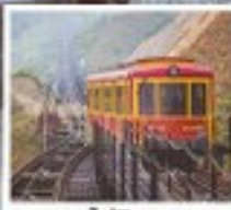
รถไฟเวียนแดง