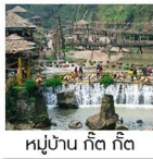
หมู่บ้าน กั๊ต กั๊ต