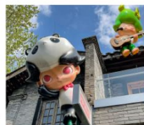
ถนนคนเดินชอยกว้างแอก