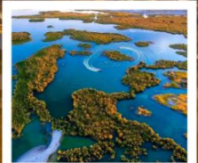
ทะเลสาบอูลุนกู๋

ผ่านทางด่วนทะเลทราย S21 / ทะเลสาบอูลุนกู๋ / ปู่อ๋อจิน / เซาโปซา / ทุ่งหญ้าอาเหอถังโก่ตี้ / หมู่บ้านเหม่อู่ซุน / คานาสี / ทะเลสาบมังกรหลับ / ทะเลสาบเทวดา จุดชมวิวกานาสี / ศาลาชมปลา / ค่องเรือทะเลสาบคานาสี / หาดห้าสี / เมืองปีศาจ / เมืองคาลามาอี / คาลามาอี / แกรนด์แคนยอนตูซันจือ / ตลาดต้าปาจา