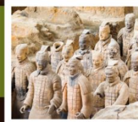
สุสานจีนซี

วัดเส้าหลิน / ป่าเจดีย์ / โชว์การแสดงวิทยายุทธเส้าหลิน / อุทยานหยุนโกซาน ศาลเจ้ากวนอู / ถ้ำหินหลงเหมิน / สุสานทหารจีนซี / ถนนคนเดินวัฒนธรรมต้าถิง โชว์ราชวงศ์ถัง / กำแพงเมืองโบราณซีอาน / วัดลามะ / ตลาดมุสลิม