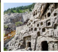
ถ้ำหินหลงเหมิน