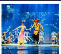
โชว์เซียนกู่ฉิง