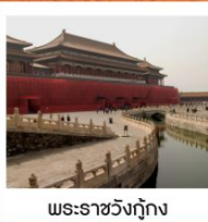
พระราชวังปักกิ่ง