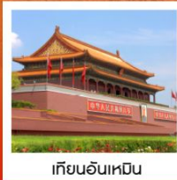
เทียนอันเหมิน

ลิ้มรสเมนูพิเศษ เปิดปักกิ่ง / สุกี่หม่าล่า