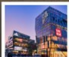
ย่านซานหลี่ตุ่น