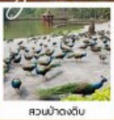
สวนน้ำดงดิบ