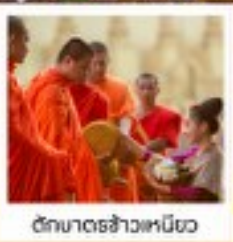
วัดมหาธาตุหลวง