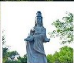
เจ้าแม่ทับทิม