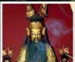
เอียงบู๊ซิว