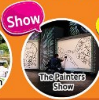
The Painters Show