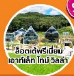
ลีสตเด่พรีเมียม เอาทเล็ก ไทน์ วิลล่า