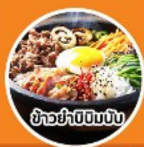
ข้าวยำบีบีมพิบ