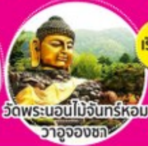
วัดพระนอนไม้จันทร์หอม วาจุงจองซา