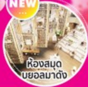
ห้องสมุด บยอลมาดัง