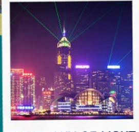
SYMPHONY OF LIGHT