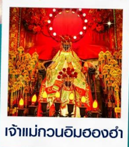
เจ้าแม่กวนอิมสองอ้า