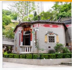
วัดหลินฟ้า