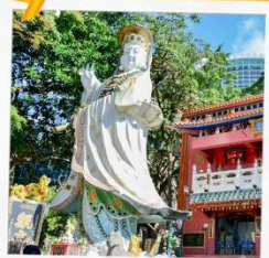
เจ้าแม่กวนอิมรพัสลาลัย

23 กุมภาพันธ์ 2568 วันเยี่ยมเงินเจ้าแม่กวนอิม วัดฮ่องฮำ