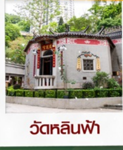
วัดหลินฟ้า