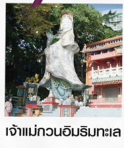
เจ้าแม่กวนอิมริมทะเล