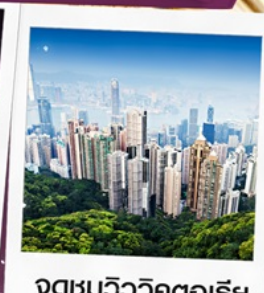
จุดชมวิวิวิคตอเรีย