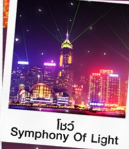
โชว์ Symphony Of Light