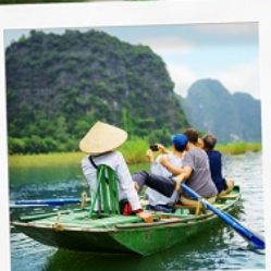
ล่องเรือ Tamcoc