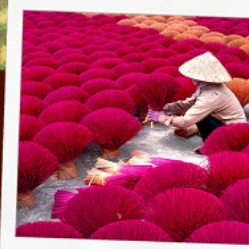
หมู่บ้านรูป