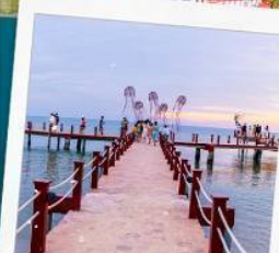
Sunset Sanato Beach Club