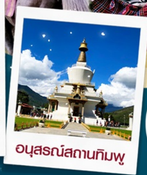
อนุสรณ์สถานทิมพู