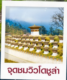
จุดชมวิวโตซูลา