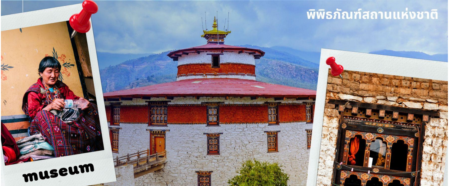
พิพิธภัณฑ์สถานแห่งชาติ

เที่ยง รับประทานอาหารเที่ยง ณ ภัตตาคาร (มื้อที่ 1)