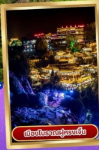
เมืองโบราณฝูหรงเจิ้น