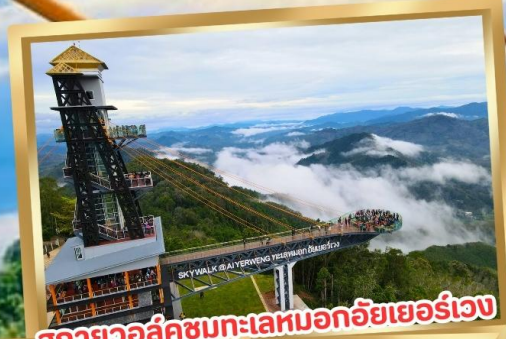
สกายวอล์คชมทะเลหมอกอัยเยอร์เวง

ร่วมโครงการ ลดหย่อนภาษี ลดสูงสุด 15,000.-