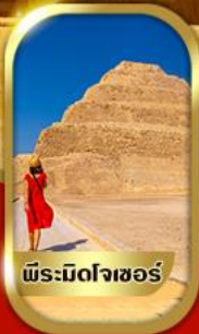
พีระมิดไฟเซอร์