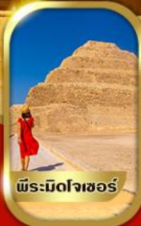
พีระมิดโจเซอร์