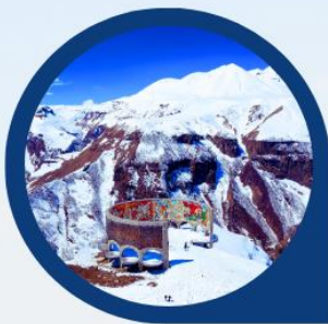
จุดถ่ายรูป Panorama Gudauri

แนวชมป้อมปราการอนานูรี (Ananuri Fortress) ป้อมปราการที่มีความเก่าแก่ของประเทศจอร์เจีย สร้างขึ้นในศตวรรษที่ 16-17 ตั้งอยู่ริมแม่น้ำ Aragvi หนึ่งในแม่น้ำสายสำคัญของประเทศจอร์เจียจากมุมสูง มีทิวทัศน์ความสวยงามของอ่างเก็บน้ำชินวาเลีย (ZHINVALI RESERVOIR) และยังมีเขื่อนซึ่งเป็นสถานที่ที่สำคัญสำหรับนำน้ำที่เก็บไว้ส่งต่อไปยังเมืองหลวง พร้อมใช้ผลิตกระแสไฟฟ้า ที่ทำให้ชาวเมืองทบิลีซีมีน้ำไว้ดื่มใช้ ร่องรอยของซากกำแพงที่ล้อมรอบป้อมปราการแห่งนี้เปรียบเสมือนม่านที่ซ่อนเร้นความงดงามของโบสถ์ 2 หลัง ที่เป็นโบสถ์เก่าแก่ 2 หลัง คือโบสถ์เก่าแก่แห่งพระนางแมรี่ผู้บริสุทธิ์ (The older Church of the Virgin) ส่วนอีกโบสถ์คือโบสถ์ยิ่งใหญ่แห่งอัสสัมชัญ