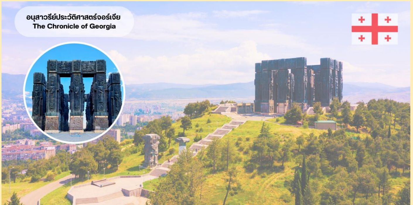
อนุสาวรีย์ประวัติศาสตร์จอร์เจีย The Chronicle of Georgia