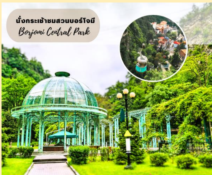
นั่งกระเช้าชมสวนบอร์โจมี Borjomi Central Park

จากนั้นนำท่านเดินทางสู่ เมืองบอร์โจมี (BORJOMI) แหล่งกำเนิดของน้ำแร่ธรรมชาติที่มีชื่อเสียงระดับโลก เป็น