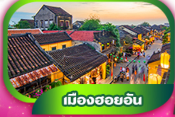
เมืองฮอยอัน