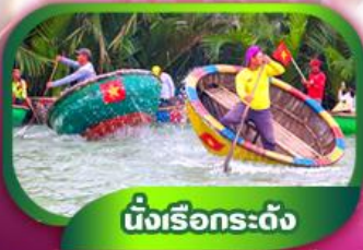
นั่งเรือกระดง