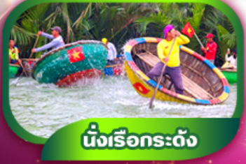
นั่งเรือกระดัง