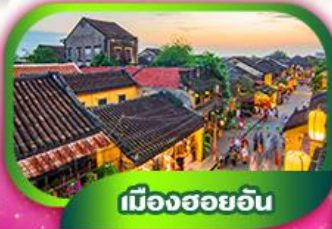
เมืองฮอยอัน