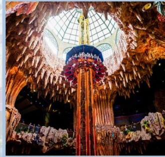
สวนสนุก Fantasy Park