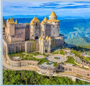
ปราสาทจันทร