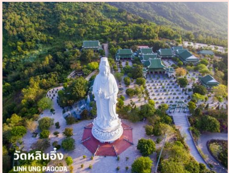
วัดหลินอึ้ง LINH UNG PAGODA

เดินทางสู่ วัดหลินอึ้ง (LINH UNG PAGODA) เป็นวัดที่ใหญ่ที่สุดของเมืองดานัง อยู่บนคาบสมุทร เซินจา ภายในวิหารใหญ่ของวัดเป็นสถานที่บูชาเจ้าแม่กวนอิมและเทพองค์ต่างๆ ไฮไลท์ของวัดนี้เป็นที่ประดิษฐานเจ้าแม่กวนอิมยืนองค์ใหญ่สีขาว ที่มีความสูงถึง 67 เมตรตั้งอยู่บนฐานดอกบัวกว้าง 35 เมตร ยืนหันหน้าออกไปทางทะเลและหันหลังให้ภูเขา คอยปกป้องคุ้มครอง วัดนี้เป็นสถานที่ศักดิ์สิทธิ์ที่ชาวบ้านนิยมมากราบไหว้ขอพรและยังเป็นอีกหนึ่งสถานที่ท่องเที่ยวจุดชมวิวที่สวยงามของเมืองดานังอีกด้วย จากนั้นนำท่านสู่ สวน WONDER PARK ถ่ายรูปกับประติมากรรมจำลอง 7 สิ่งมหัศจรรย์ของโลก เช่น หอไอเฟล ประตูชัยฝรั่งเศส พีระมิด เป็นต้น