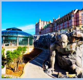
โซล Eclipse Square