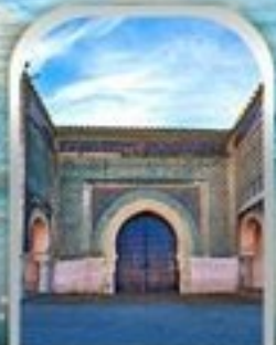
KASBAH OF MOULAY ISMAIL