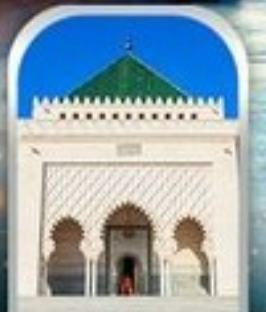
MOHAMMED V SQUARE