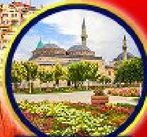
พีธีร์กันทันเปลานา