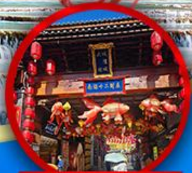
เมืองโบราณต้าลี่