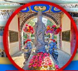
เจ้าแม่กวนอิมต้าลี่