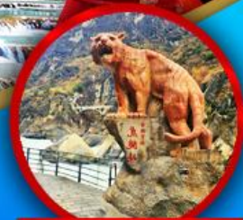
ช่องเขาเสือกระโจน