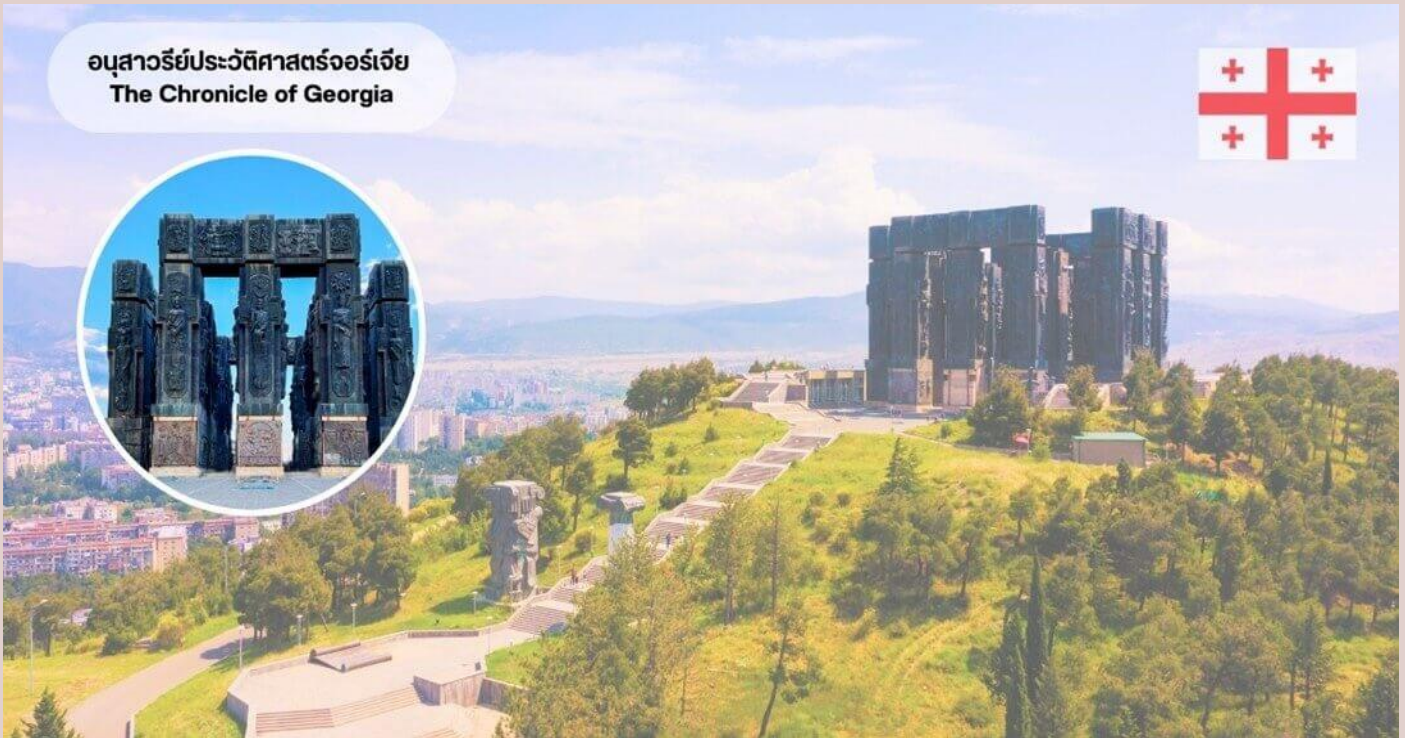
อนุสาวรีย์ประวัติศาสตร์จอร์เจีย The Chronicle of Georgia

เป็นเรื่องราวของข้าราชการชั้นสูง และชั้นบนสุดบอกเล่าถึงเหตุการณ์สำคัญของจอร์เจีย ท่านสามารถชมวิวเมืองจากมุมสูงได้จากสถานที่แห่งนี้