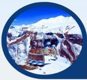
จุดถ่ายรูป Panorama Gudauri

แวะจุดถ่ายรูปแบบพาโนรามา 360 องศา ณ อนุสาวรีย์มิตรภาพรัสเซีย-จอร์เจีย (Russia-Georgia Friendship Monument) เป็นอนุสาวรีย์ที่โครงสร้างทั้งหมดทำจากหินและคอนกรีตทรงกลมขนาดใหญ่ ถูกสร้างขึ้นในปี ค.ศ. 1983 เพื่อเฉลิมฉลองเนื่องในโอกาสครบรอบ 200 ปี ของสนธิสัญญา Georgievsk ภายในตกแต่งด้วยกระเบื้องโมเสกสีสดใส บอกเล่าถึงเรื่องราวประวัติศาสตร์และวิถีชีวิตของชาวรัสเซียและชาวจอร์เจียเอาไว้ อนุสาวรีย์แห่งนี้ตั้งตระหง่านอยู่บนหุบเขา สามารถชมวิวได้แบบพาโนรามา 360 องศา และยังสามารถมองเห็นหุบเขาปีศาจ (Devil's Valley) ซึ่งเป็นส่วนหนึ่งของเทือกเขาคอเคซัส