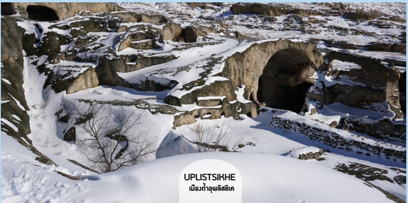
UPLISTSIKHE เมืองถ้ำอพลิสซิกเค

ชมเมืองถ้ำโบราณอพลิสซิกเค (Uplistsikhe) ตามภาษาจอร์เจียน แปลว่า “ป้อมปราการของขุนนาง” สัญลักษณ์ของความโบราณและความเป็นเอกลักษณ์ของจอร์เจีย อายุกว่า 3,000 ปีแล้ว เมืองนี้ใช้การสร้างโดยเจาะภูเขาหินจนลึกเข้าไปเป็นถ้ำ และมีการอยู่อาศัยกันจนเป็นชุมชนใหญ่ มีทั้งที่พักอาศัย ร้านค้า โบสถ์ คู่อื่นๆ รอบๆ เมืองยังมีวิวเทือกเขา และแม่น้ำมิควารีที่สวยงามด้วยเมืองถ้ำ ทั้งหมดถูกสร้างขึ้นตั้งแต่สมัยต้นยุคเหล็ก จนถึงปลายยุคกลาง ที่ให้กลิ่นอายผสมผสานระหว่างวัฒนธรรมของดินแดนอนาโตเลียของตุรกี ผสมผสานกับดินแดนเปอร์เซียของอิหร่าน โดยนักโบราณคดีได้สันนิษฐานว่าที่นี่ถือเป็นแหล่งที่อยู่อาศัยที่เก่าแก่ที่สุดในประเทศ ปัจจุบันได้รับการขึ้นทะเบียนให้เป็นมรดกโลกโดยองค์การยูเนสโก