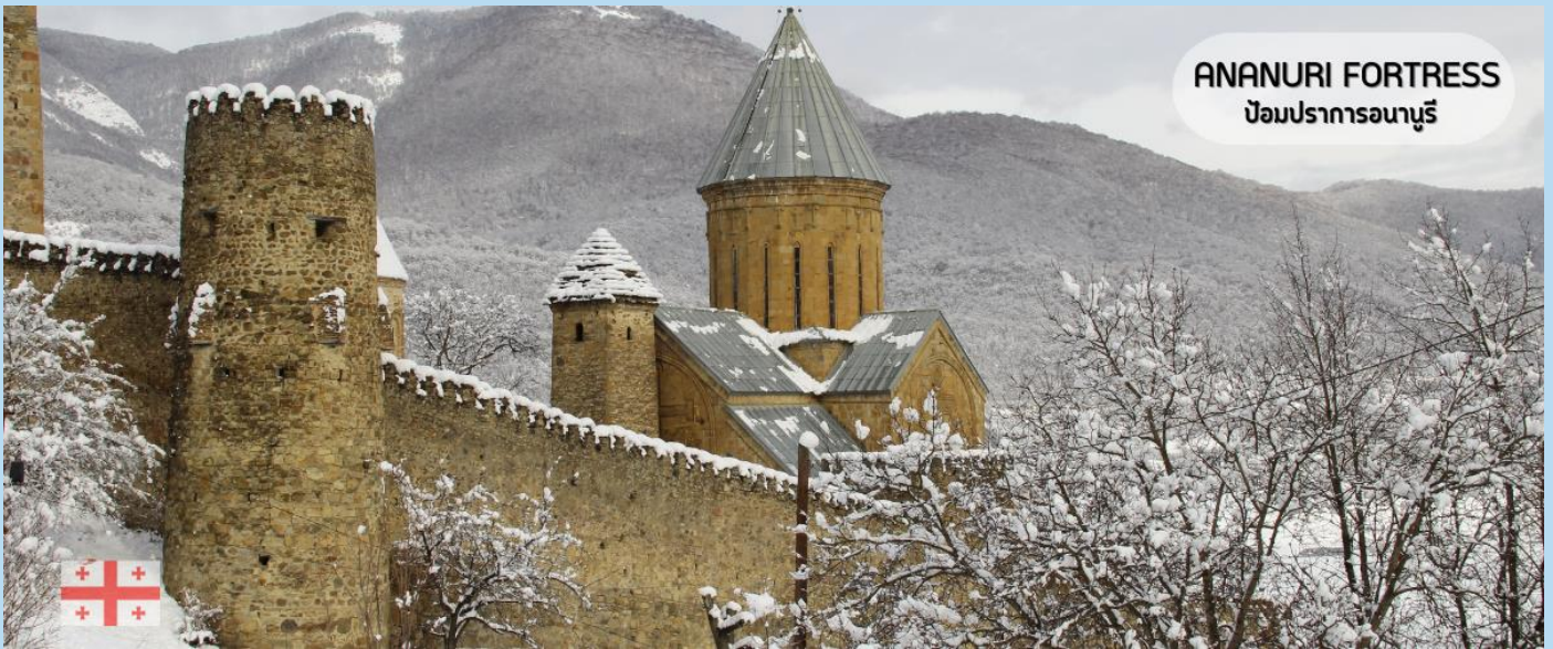
ANANURI FORTRESS ป้อมปราการอนานูรี