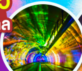
อิมเมจเจอร์