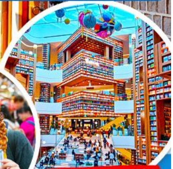
หมู่บ้านเกาหลี