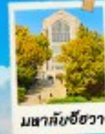
พิพิธภัณฑ์ช็องวา