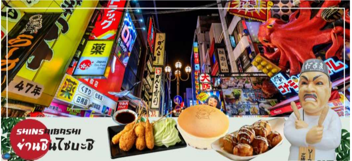
เย็น รับประทานอาหารเย็นอิสระตามอัธยาศัย

อิสระช้อปปิ้ง ย่านชินไซบาชิ (Shinsaibashi) บริเวณแหล่งช้อปปิ้งแห่งนี้มีความยาวประมาณ 600 เมตร เต็มไปด้วยร้านค้าปลีก ร้านแฟชั่นร้านเครื่องสำอางค์ ร้านรองเท้า กระเป๋า นาฬิกา ร้านกาแฟ ร้านอาหาร ร้านขนม ร้านเสื้อผ้าสตรีทแบรนด์ทั้งญี่ปุ่นและต่างประเทศ เช่น Zara H&M Beans ABC Mart เป็นต้น เรียกว่ามีทุกอย่างที่ต้องการรวมกันอยู่บริเวณนี้ ใกล้กันท่านสามารถเดินไปยัง ย่านโดทงโบริ (Dotonbori) ย่านบันเทิงยามค่ำคินดอลอดแนวถนนเลียบบคลองโดทงโบริ จากสะพานโดทงโบริบาชิไปจนถึงสะพานนิปปอนบาชิ ไฮไลท์!!! ใครๆ ก็เชิดฉิ่ง ถ่ายภาพคู่ ป้ายกูลิโกะแมน หรือ ป้ายโดทงโบริกูลิโกะ (Dotonbori Glico Sign) เป็นป้ายไฟนีออนรูปนักกรีฑากำลังวิ่งอยู่บนลู่วิ่ง ซึ่งถูกติดตั้งมาตั้งแต่ ปี ค.ศ.1935 นอกจากนี้ยังมีอีกหนึ่งสัญลักษณ์สถานที่นัดพบกันหลง นั่นก็คือ ร้านปูคานิโดรากุ (Kani Doraku) ซึ่งมีปูยักษ์ขยับแขนและลูกตาได้อีกด้วย และห้ามพลาดสำหรับทาโกะยากิ อาหารท้องถิ่นของชาวโอซาก้า ที่มาถึงถิ่นแล้วต้องลอง Original Taste รับรองไม่ผิดหวังแน่นอน