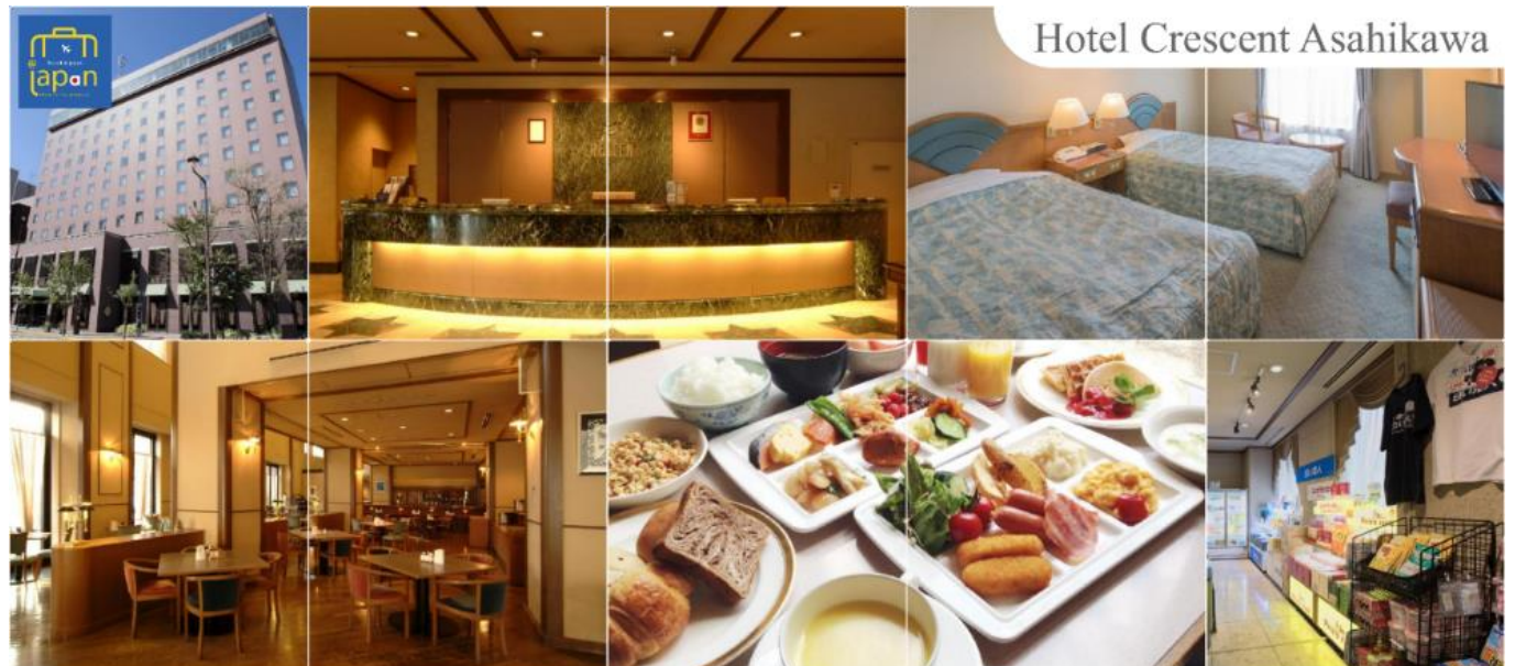
Hotel Crescent Asahikawa

รับประทานอาหารเย็น ณ ภัตตาคาร (6) HOTEL CRESCENT ASAHIKAWA หรือเทียบเท่า