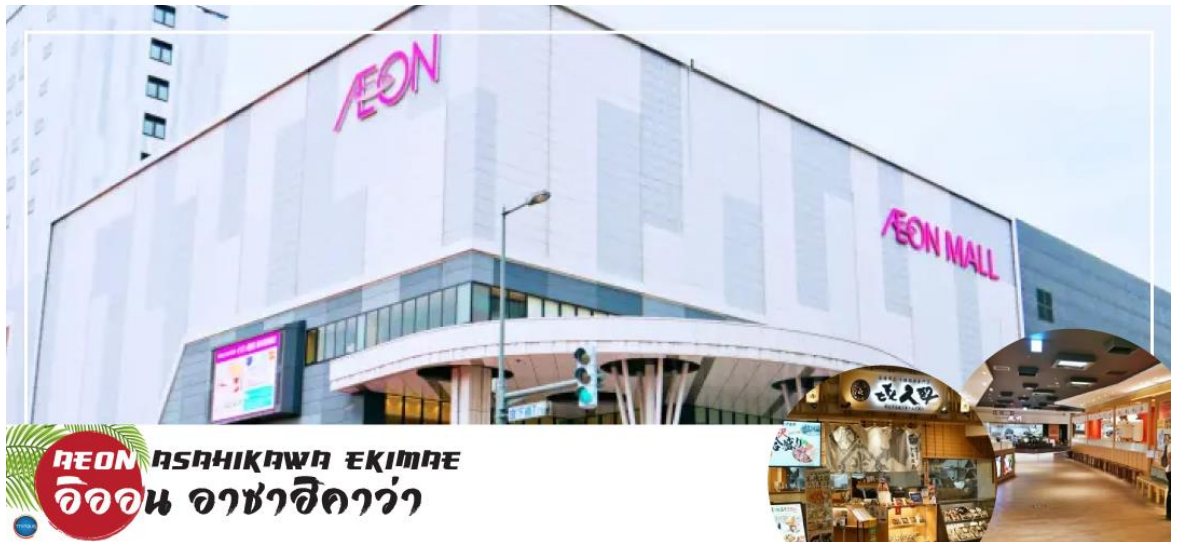
AEON ASAHIKAWA EKIMAE อียอน อาซาฮิคาว่า

นำท่านช้อปปิ้ง ณ อียอน อาซาฮิคาว่า (AEON Asahikawa Ekimae) ห้างสรรพสินค้าขนาดใหญ่ของอาซาฮิคาว่า อิสระให้ท่านได้เลือกซื้อของฝากของที่ระลึกกัน อาทิ ขนมโมจิ เบนโตะ ผลไม้ และขนมขึ้นชื่อของญี่ปุ่น อย่าง คิทแคท สามารถหาซื้อได้ที่นี้เช่นกัน