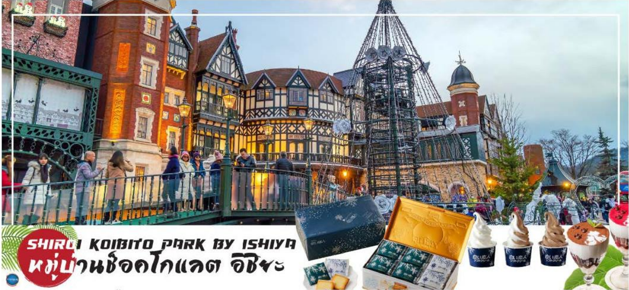
SHIROI KOIBITO PARK BY ISHIYAKI หมู่บ้านช็อคโกแลต อิชียะ

โกแลตที่ขึ้นชื่อที่สุดของที่นี่คือ Shiroi Koibito ซึ่งมีความหมายว่าช็อคโกแลตขาวแต่คนรัก ท่านสามารถเลือกช็อคกลับไปให้คนที่ท่านรักทานหรือว่าซื้อเป็นของฝากติดไม้ติดมือกลับบ้านก็ได้ นอกจากนี้ท่านจะได้เลือกซื้อช็อคโกแลตที่หาซื้อที่ไหนไม่ได้ และ ท่านก็ยังจะได้ชมประวัติความเป็นมาของโรงงาน และการผลิตช็อคโกแลตอีกด้วย