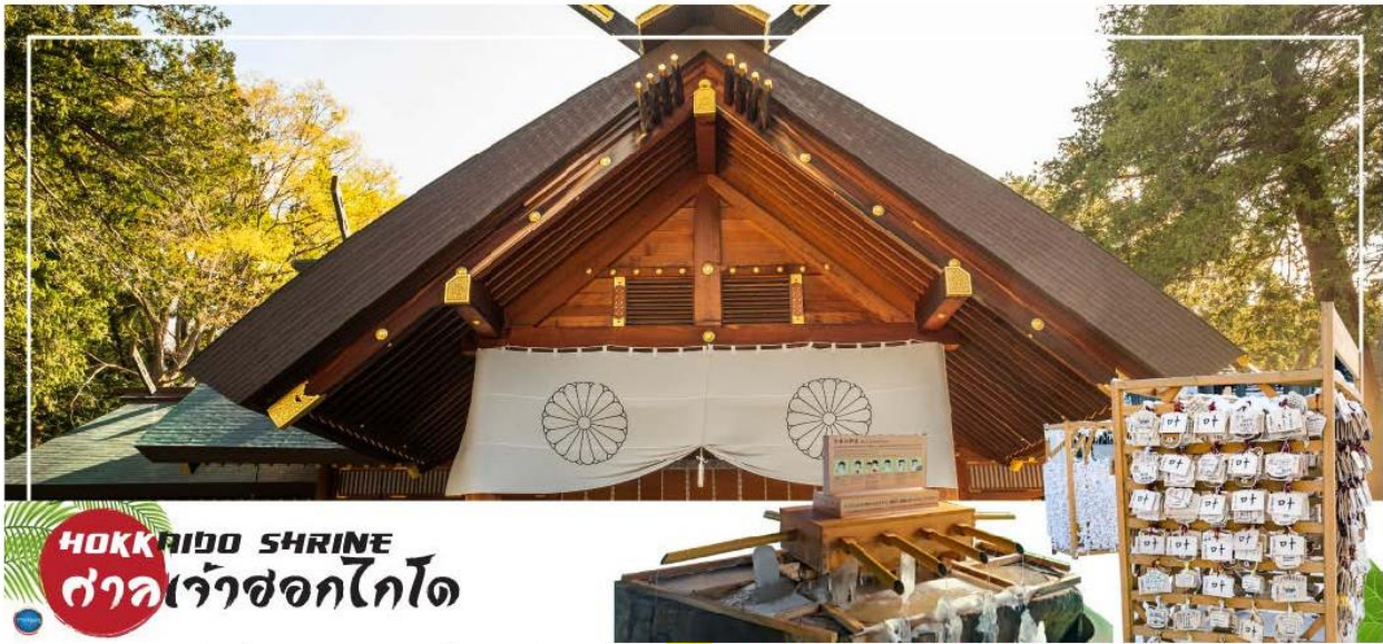
HOKKAIDO SHRINE ศาลเจ้าฮอกไกโด

นำท่านเดินทางสู่ เมืองซัปโปโร (SAPPORO) (ใช้เวลาเดินทางประมาณ 2.30 ชั่วโมง) นำท่านขอพร ศาลเจ้าฮอกไกโด (Hokkaido Shrine) หรือเดิมชื่อ ศาลเจ้าซัปโปโร เปลี่ยนเพื่อให้สมกับ ความยิ่งใหญ่ของเกาะเมืองฮอกไกโด ศาลเจ้าชินโตนี้คอยปกป้องรักษา ให้ชนชาวเกาะฮอกไกโดมีความสุขถึงแม้จะไม่ได้มีประวัติศาสตร์อันยาวนาน นำท่านเดินทางสู่ ย่านซุซุกิโนะ (Susukino) นับเป็นย่านที่เต็มไปด้วยแหล่งบันเทิงที่โด่งดังมากที่สุดของเมืองซัปโปโร (Sapporo) อีกทั้งยังเรียกได้ว่าเป็นย่านบันเทิงที่ใหญ่ที่สุดในทางตอนเหนือของญี่ปุ่นทีเดียวล่ะค่ะ บอกเลยว่าอยากมาบันเทิงใจยามค่ำคืนสัมผัสไลฟ์สไตล์แบบคนญี่ปุ่นแท้ๆ ต้องมาที่นี่ให้ได้เลยล่ะค่ะ เพราะเต็มไปด้วยร้านค้า บาร์ ร้านอาหาร ร้านคาราโอเกะ และตู้ปาจิงโกะ รวมกว่า 4,000 ร้าน บางร้านนี้เปิดจนถึงเที่ยงเที่ยงคืน