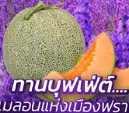
ทานบุฟเฟ่ต์... เมลอนแห่งเมืองฟูราโน