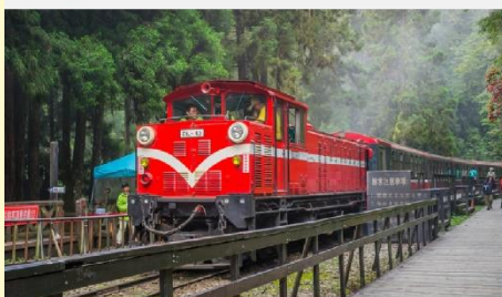
อุทยานแห่งชาติตาสีซาน