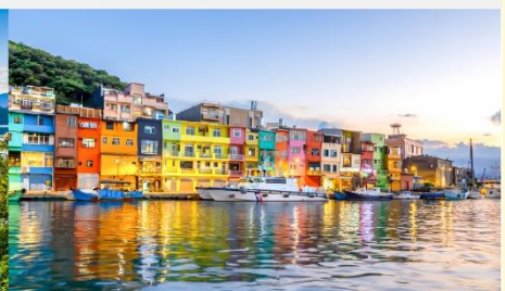
ทำเรือประมงเจิ้งปิ่น

*ทางบริษัทฯ ขอสงวนสิทธิ์ในการสลับโปรแกรมทัวร์ตามความเหมาะสมขึ้นอยู่กับสถานการณ์หน้างาน โดยคำนึงถึงผลประโยชน์ของลูกค้าเป็นสำคัญ