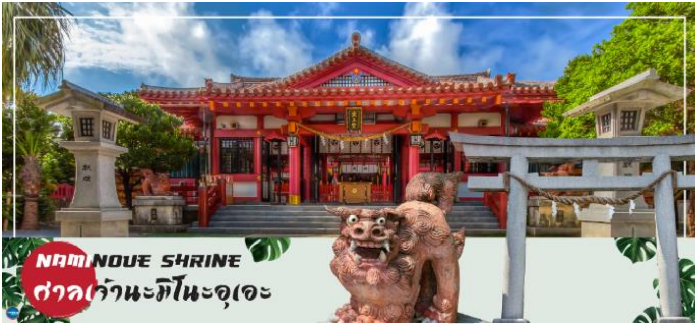
NAMINOUE SHRINE ศาลเจ้านะมิโนะอุเอะ

ศาลเจ้านามิโนะอุเอะ – อาชิบิโนะ เอาท์เล็ตมอลล์ – ท่าอากาศยานนาฮะ โอกินาวะ – ท่าอากาศยานดอนเมือง กรุงเทพฯ