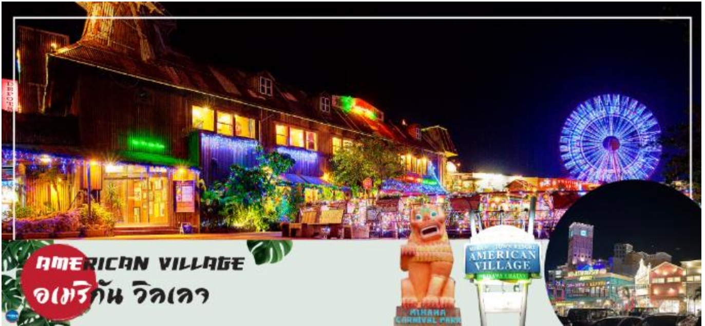
รวมกันอยู่ที่นี้เกือบทั้งหมด

จากนั้นนำท่านสู่ อเมริกัน วิลเลจ (American Village) (ใช้เวลาเดินทางประมาณ 50 ชั่วโมง) ตั้งอยู่ในเมืองที่มีชื่อว่า ซาตัง อยู่ตอนกลางของโอกินาวา สร้างเลียนแบบแหล่งช้อปปิ้งย่านชานดิเอโกในประเทศสหรัฐอเมริกา ที่นี่เป็นแหล่งช้อปปิ้งที่มีสินค้าสารพัดหลากหลายสไตล์ให้ท่านได้เลือกสรร นอกจากนี้ยังมีสถานที่บันเทิงสร้างความสนุกสนาน เช่น โรงภาพยนตร์, โบว์ลิ่ง, คาราโอเกะ, เกมเซ็นเตอร์, ซิงซ์าสวรรค์, โลฟิเฮ้าส์, บาร์, ร้านอาหาร, ร้านหนังสือ, ร้านเสื้อผ้า และร้านตัวแทนจำหน่ายตัวเครื่องมินิ โรงแรม และชายหาด เรียกได้ว่ามีร้านค้าต่างๆ