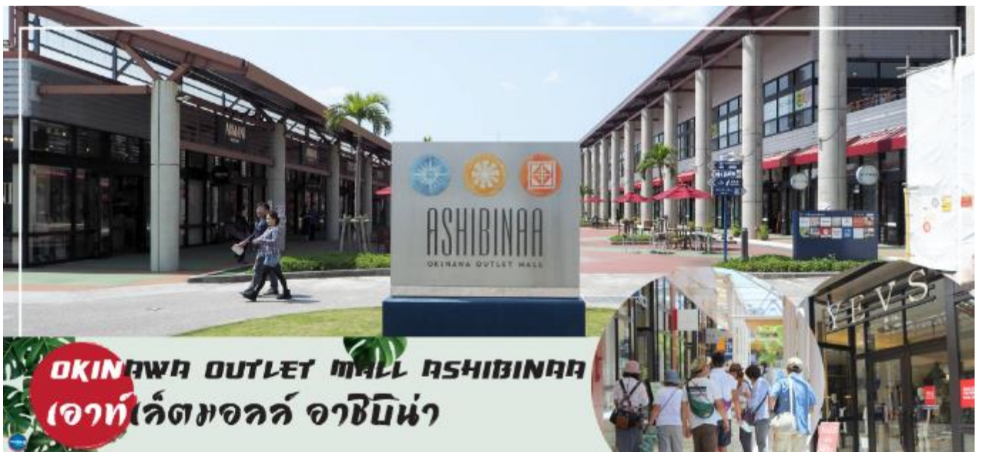
OKINAWA OUTLET MALL ASHIBINAA เอาท์เล็ตมอลล์ อาชิบิโนะ

(ใช้เวลาเดินทางประมาณ 30 นาที) เอาท์เล็ตแห่งแรกในโอกินาวะ รวบรวมร้านค้าชั้นนำกว่า 100 ร้าน ทั้งเสื้อผ้าแฟชั่น สินค้าแบรนด์เนม นาฬิกา ข้าวของเครื่องใช้ ของเล่น ทุกร้านจัดเต็มทั้งสินค้านำเข้าและรุ่นใหม่ ลดราคากระหน่ำกว่า 30-80% ให้ได้เดินช้อปปิ้งท่ายุโรปกันอย่างจุใจ ภายใต้บรรยากาศสบายๆ สไตล์รีสอร์ทริมทะเล หากช้อปปิ้งเหนื่อยสามารถขึ้นไปทานอาหารที่ชั้น 2 มีอีกหลายร้านที่คอยให้บริการ