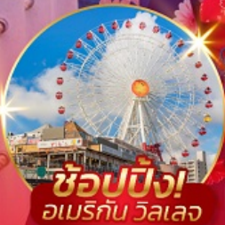
ชูปปิ้ง! อเมริกัน วิลเลจ