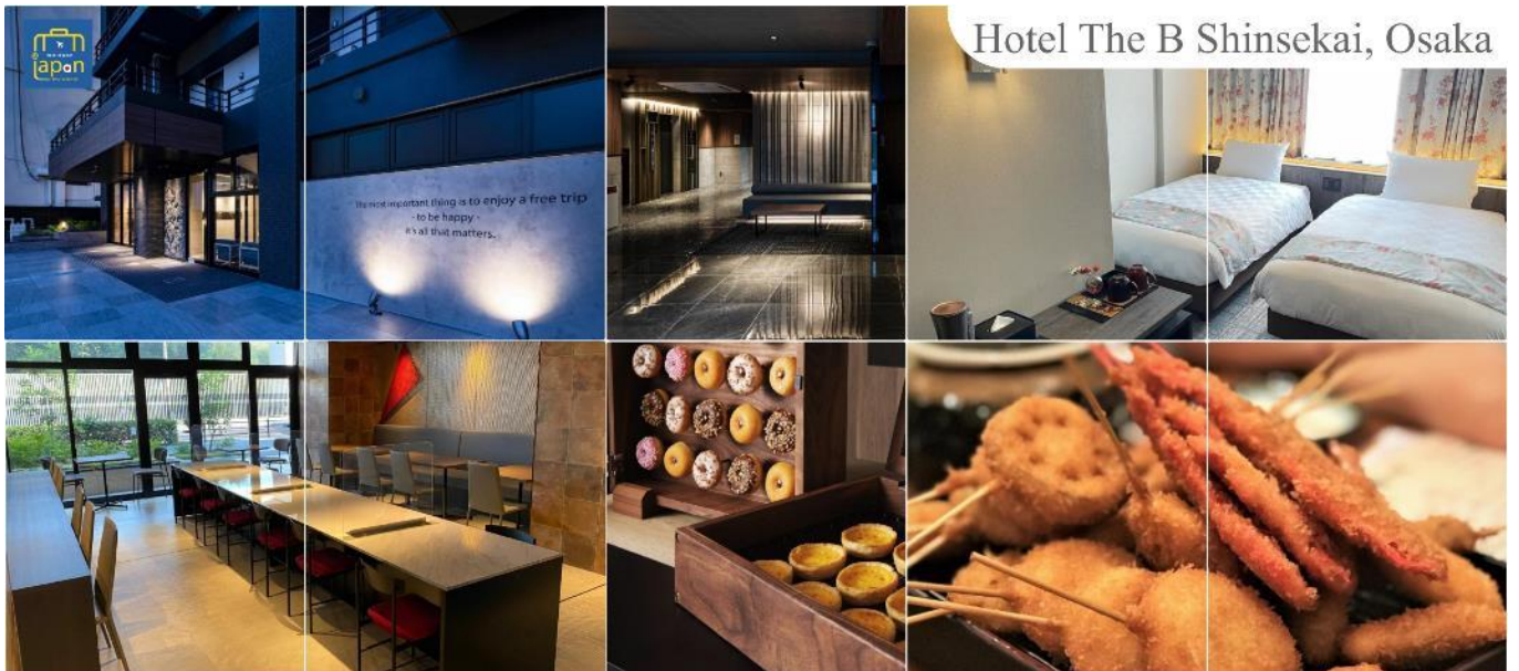
Hotel The B Shinsekai, Osaka

HOTEL THE B SHINSEKAI, OSAKA หรือเทียบเท่าระดับเดียวกัน